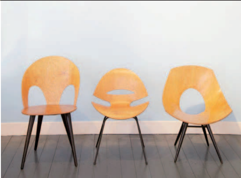
Drie plywoodstoelen uit de jaren vijftig (foto: WonderWood).