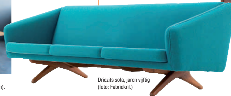
Driezits sofa, jaren vijftig.