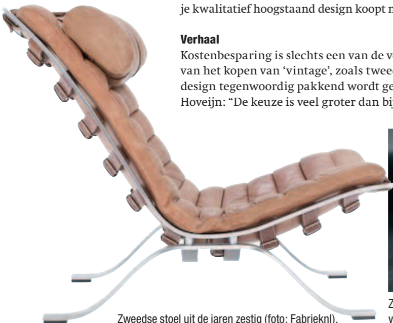
Zweedse stoel uit de jaren zestig.