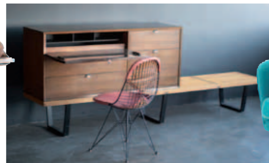
Zeldzame 'guestroom unit' uit 1948, van George Nelson voor Herman Miller.