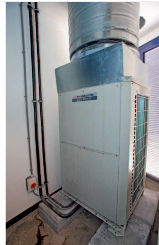
Het in pandig plaatsen van de ventilatie-warmtepomp geeft 500% rendement

“Omdat je op deze manier de temperatuur van binnen met die van buiten mengt om te koelen dan wel te verwarmen, zijn de temperatuurverschillen kleiner en is er dus minder vermogen nodig om tot de juiste temperatuur te komen”, legt Van Merwijk uit. “Je moet in een praktijk natuurlijk wel zorgen dat er bijvoorbeeld geen narcosegas mee wordt genomen, dus de operatiekamers worden apart afgezoegen. Zodra op een van de twee OK's