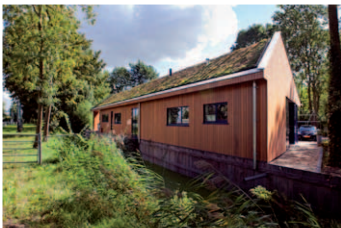
De praktijk is volledig duurzaam gebouwd; het dak is bedekt met vetplantjes