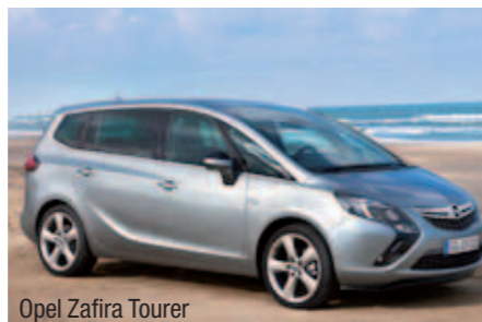
Opel Zafira Tourer

go/Peugeot Partner (identiek), Dacia Dokker, Fiat Doblo/Opel Combo (ook identiek), Ford Transit Connect, Renault Kangoo, Mercedes-Benz Citan en Volkswagen Caddy zijn daarvan voorbeelden. Die zijn erg ruim, maar relatief eenvoudig afgewerkt. Nóg een maat groter is er ook. Een Volkswagen Transporter in een aangeklede versie is een heel fijne auto om te rijden, met enorm veel zit- en berg-ruimte. Hetzelfde geldt voor een Ford