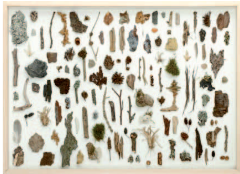
herman de vries from the forest floor , 2010