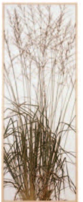
herman de vries rasenstück , 2004.

Biënnale van Venetië, 9 mei t/m 22 november 2015 venicebiennale.nl