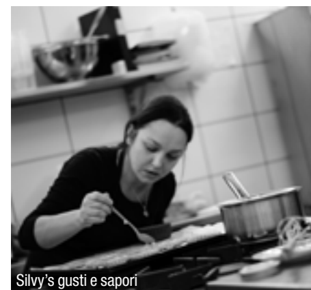
Silvy's gusti e saporì