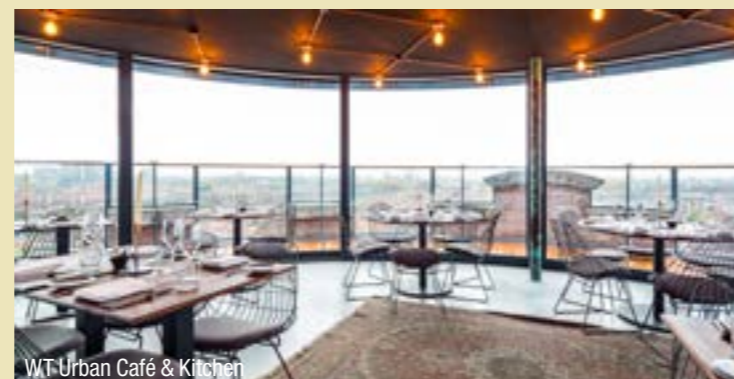
WT Urban Café &amp; Kitchen

Silvy's gusti e saporì, Stationsstraat 24, Middelburg. silvys.nl